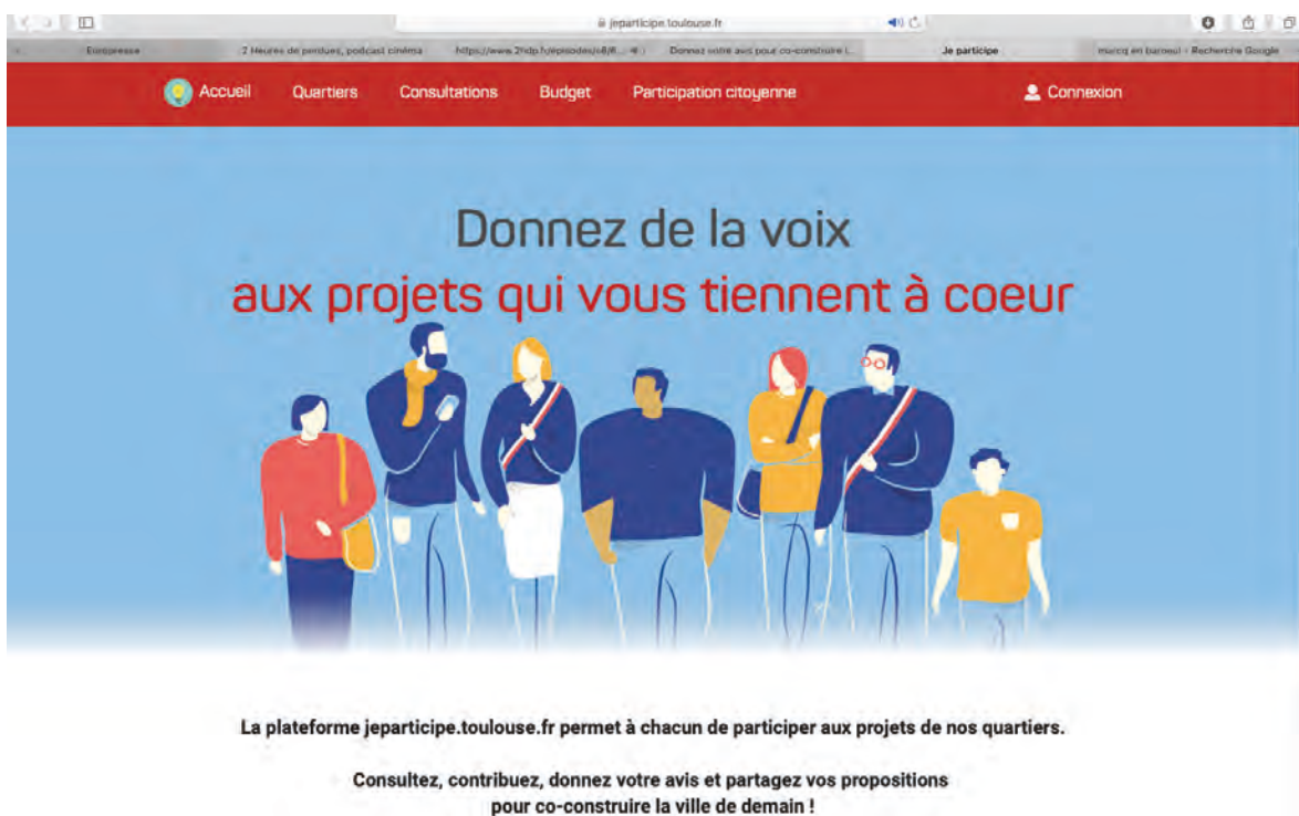
Figure 1. Présentation de la plateforme. Source : https://jeparticipe.toulouse.fr/ consulté le 21 janvier 2020

La plateforme jeparticipe.toulouse.fr permet de contribuer , donner son avis, faire des propositions et voter sur une démarche de participation de la collectivité. Elle permet aussi de s'informer des sujets discutés et de visualiser toutes ces démarches au travers d'une cartographie.