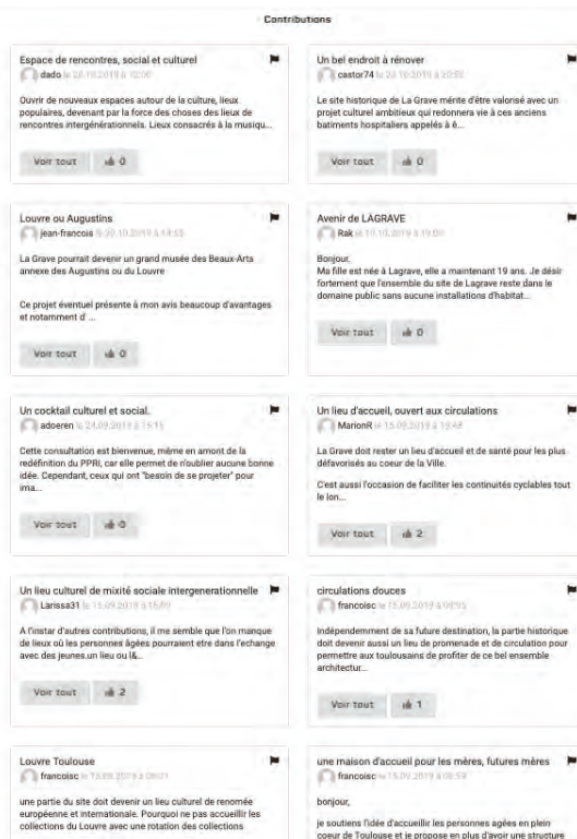
Figure 2. Contributions d'une consultation. Source : https://jeparticipe.toulouse.fr/processes/la-grave consulté le 21 janvier 2020