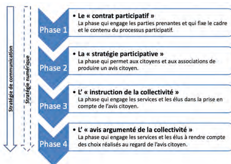
Figure 1. Schéma chronologique de la participation à la Métropole Européenne de Lille selon la méthodologie de référence.

Dans ce cadre-là, l'usage du numérique est apparu comme une évidence car le programme du mandat est tourné vers l' innovation et a pour objectif d'atteindre un maximum de personnes. Et ce d'autant plus que sur un territoire aussi vaste, avec une population aussi importante, le présentiel seul ne permet pas de faire de la concertation sur toute la métropole « ni humainement, ni temporellement, ni techniquement ».